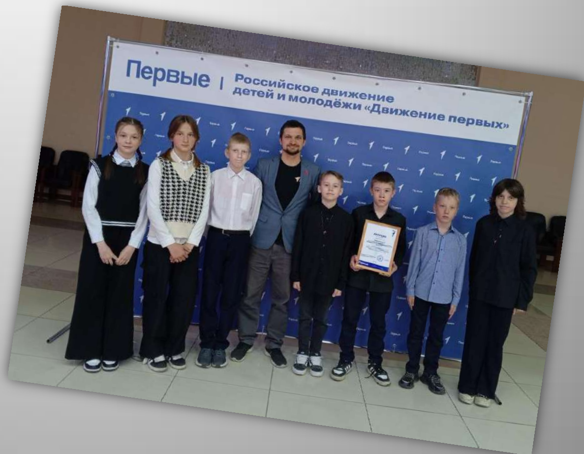
Муниципальное общеобразовательное учреждение средняя общеобразовательная школа № 8