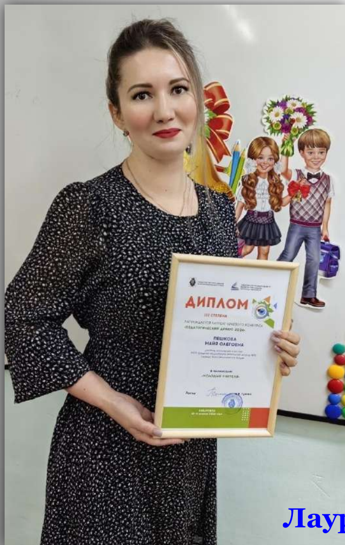
Лауреат 3 степени конкурса «Педагогический дебют»