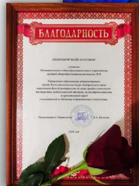
Награждена Благодарностью Управления образования г. Комсомольска-на-Амуре